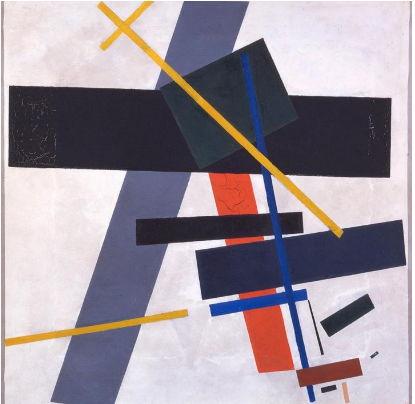
Kazimir Malevich, Suprematismo. 1915