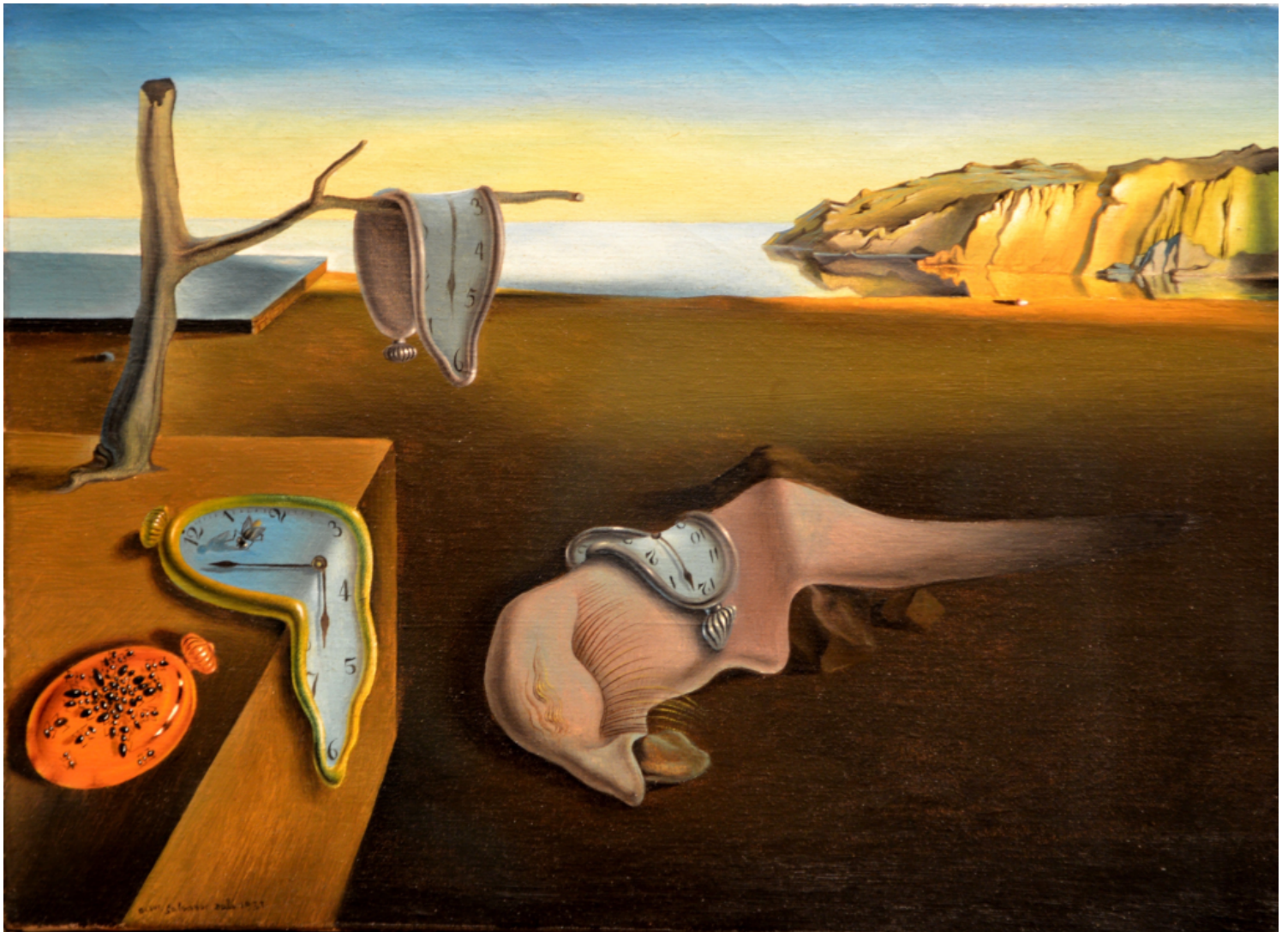
Salvador Dalí, La persistencia de la memoria. 1931