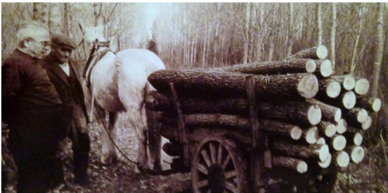
Actividad forestal en el Delta.

“Las ciudades masificadas”, capítulo final de “Latinoamérica, las ciudades y las ideas” de José Luis Romero marcó a fuego mi percepción de la cotidianeidad urbana. Lo he leído recurrentemente a lo