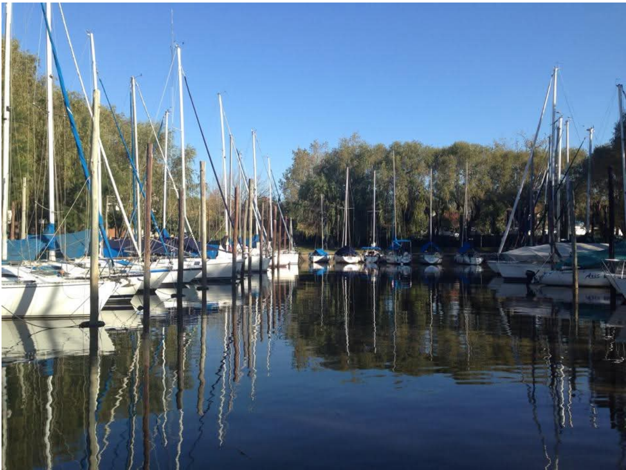
El Delta en la actualidad.

circulando reconvertidas en almacenes ambulantes. La inmensa mayoría de las "colectivas" no son sino aquellas confeccionadas por los armadores hacia fines de los 40. Recorren sus itinerarios respetando los mismos horarios planificados y constituyen un ámbito flotante de sociabilidad entre vecinos, turistas y maestras. Las maniobras de atraque de diestros capitanes asistidos por sus marineros suscitan la sensación de una temporalidad estancada corroborada los fines de semana por antiguos botes de regatas impulsados por esforzados remeros mezclados con los más modernos kajacs además de los cruceros, yates, lanchas particulares, despensas flotantes y lanchones madereros. Solo postales de un frenético y silencioso "rio de fondo" sociocultural que las grandes mareas, por ahora olvidadas, ponían al descubierto con su correlato de nuevas jurisdicciones, poderes y referentes solo comprensibles para aquellos que sorteaban las pruebas del "mal del sauce".