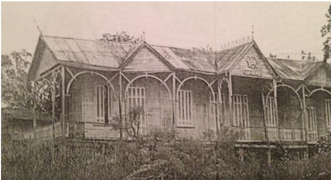
Casa de trabajadores isleños, 1930.

sino la parquización distinguida de sus "quintas", la calidad de las guarderías náuticas, la eficiencia de los mecánicos y los costos de eventuales viajes al Uruguay en asociaciones deportivas cuya proximidad con miembros del establishment les ofrecía la satisfacción de haber quedado del lado de los "ganadores". Ya hacia los 90, las remotas posibilidades de acceder a un lote en las nuevas y caras urbanizaciones isleñas como Santa Mónica, Isla del Este o Nordelta.