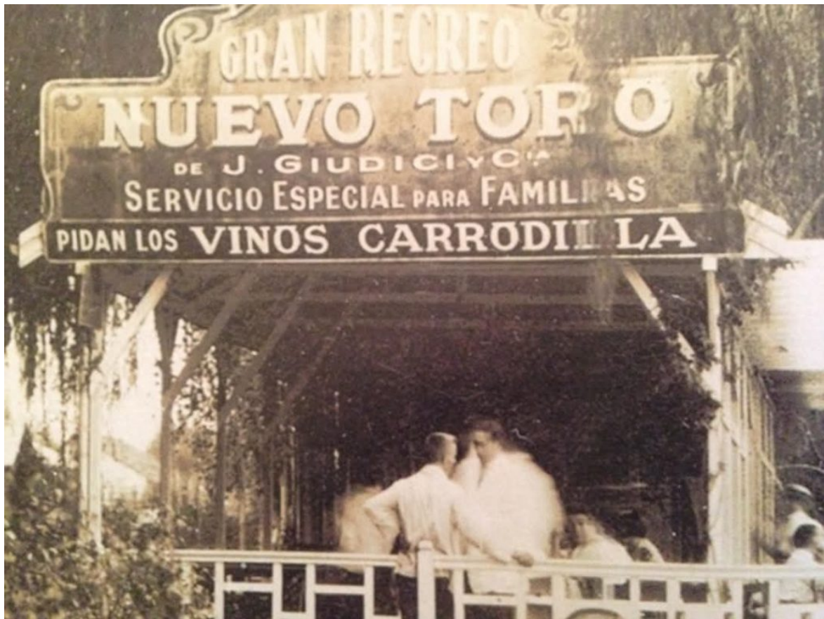
Recreo "Nuevo Toro", 1940.