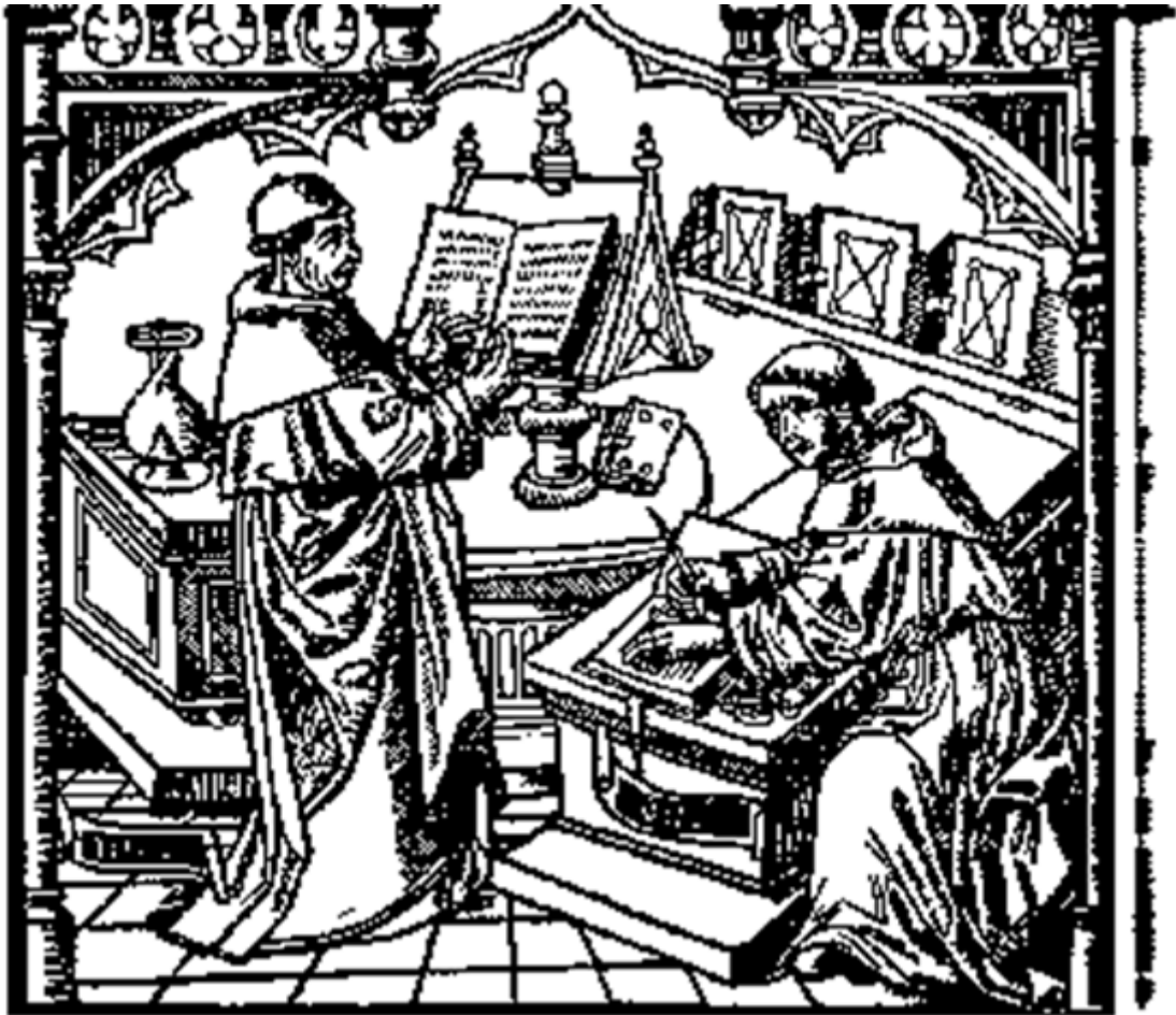
Imagen 4. Portada del Dialogus de Guillermo de Ockham, 1494.