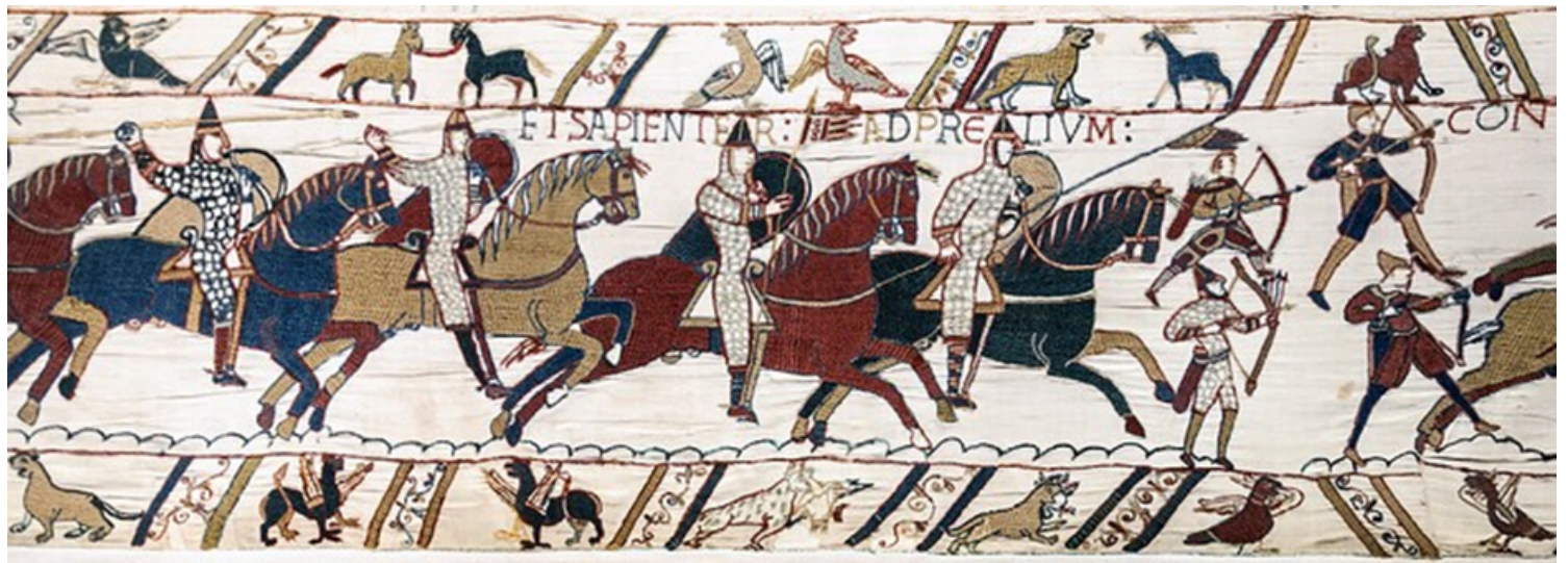
Imagen 1. El tapiz de Bayeux, Batalla de Hastings (1066).