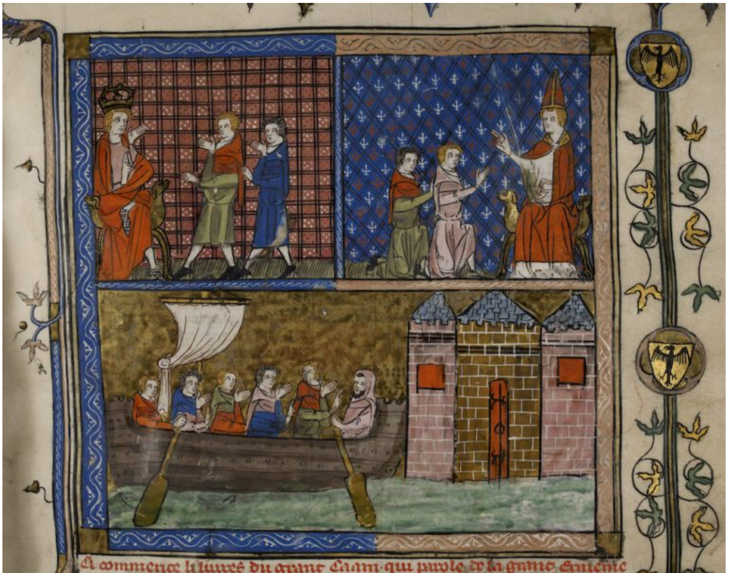
Imagen 2. Livres du Grant Caam o Viajes de Marco Polo (Francia, post 1333).