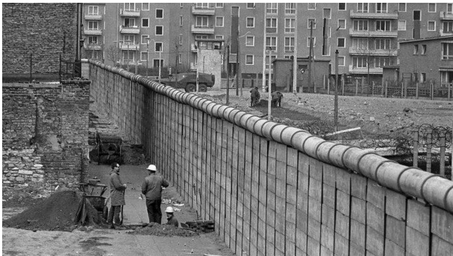
Muro de Berlín

Desde marzo de 1954 a septiembre de 1955, José Luis Romero escribió los editoriales internacionales del diario La Nación ; esto quiere decir que durante un año y medio elaboró de uno a dos editoriales por semana, una exigente reflexión acerca de los principales acontecimientos políticos internacionales de su tiempo.