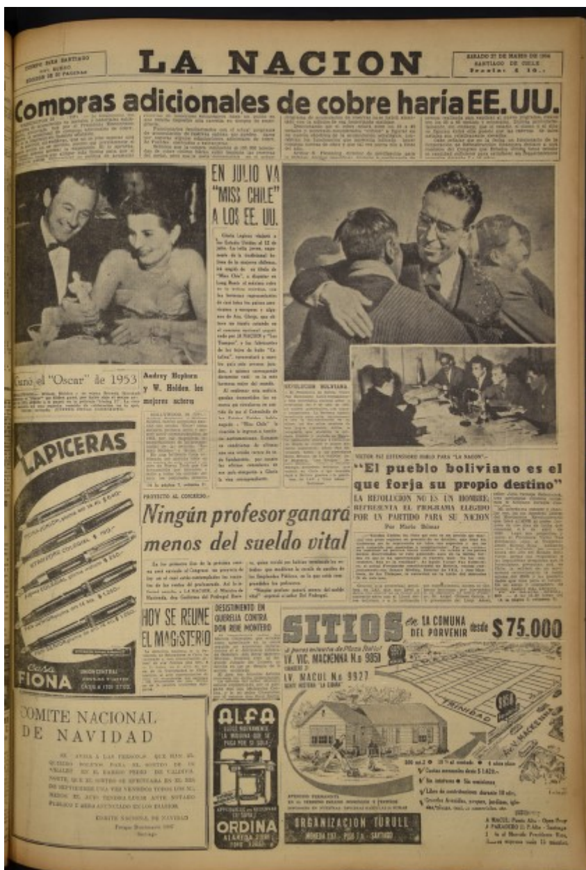
Tapa de La Nación, 27 de marzo de 1954.

En la página editorial, que no suelen ser escrita por los directivos sino por periodistas o escritores designados por las autoridades del diario, también se establece un acuerdo que a veces es tácito y a veces es expreso. Sin embargo, en este punto también son necesarias algunas consideraciones. Entre los directivos y el escritor se arriba a un acuerdo alrededor de las posiciones que todo diario con página editorial sostiene, pero ese acuerdo posee la flexibilidad que impone la propia realidad cotidiana y las alternativas y vicisitudes del lenguaje. Un diario se escribe todos los días, y si bien toda opinión responde a ciertos posicionamientos ideológicos, culturales, religiosos o políticos, las exigencias de lo cotidiano suelen desbordar incluso las posiciones más rígidas. Pero no solo lo real,