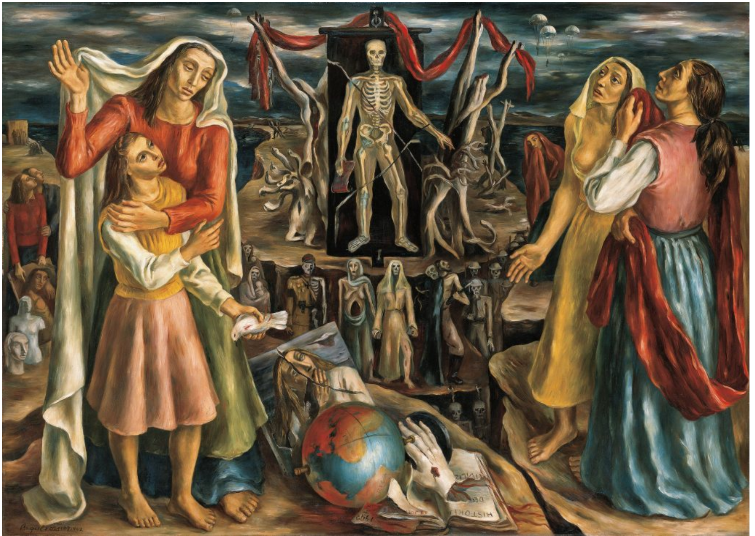
El drama. Raquel Forner, 1942

Como ha de comportarse el complejo social que constituyen las masas argentinas, es cosa incierta. Pero algunos datos pueden obtenerse de ciertos hechos, pues se asiste al acrecentamiento de la influencia de la masa criolla especialmente en las ciudades. No debe desdeñarse el hecho de la despoblación de los campos, que ha de traer importantes consecuencias en el orden económico y social. Acaso alrededor de este problema se reordenan las filas para las contiendas políticas de los próximos cincuenta años.