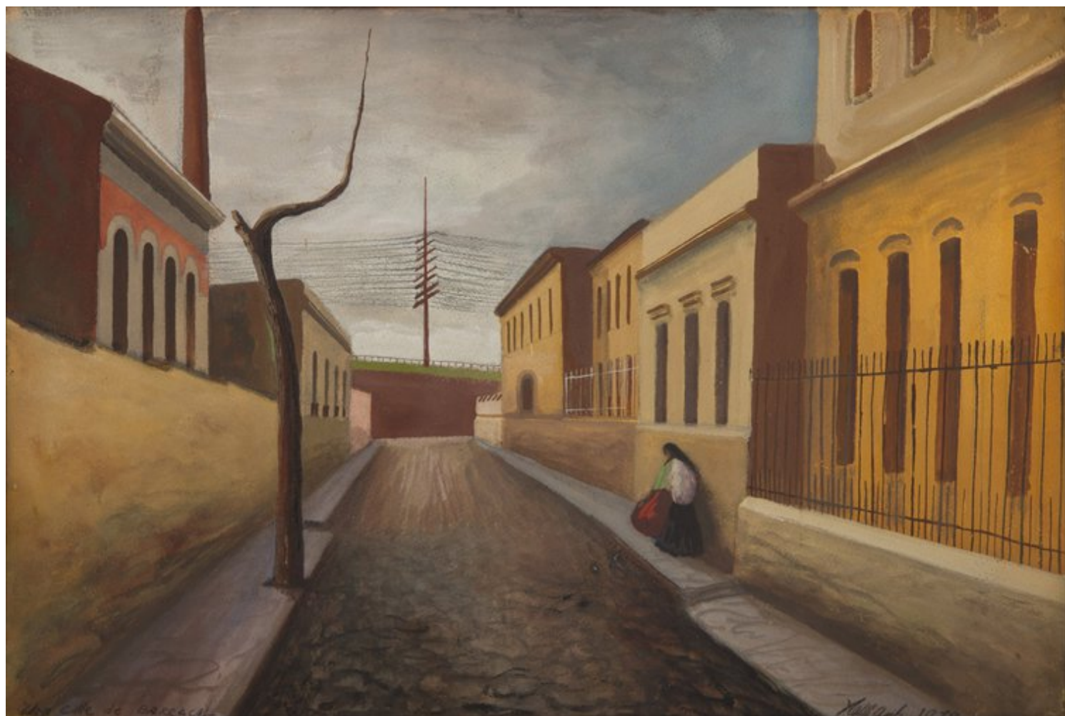
Una calle de Barracas.