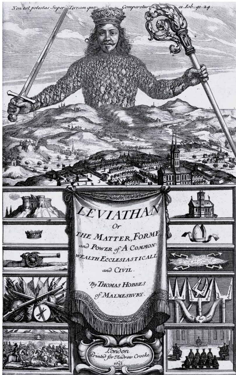
Portada de Leviathan de Thomas Hobbes. Abraham Bosse, c. 1651.

José L. Romero, La crisis medieval ", en Escritura , Montevideo, noviembre de 1950.