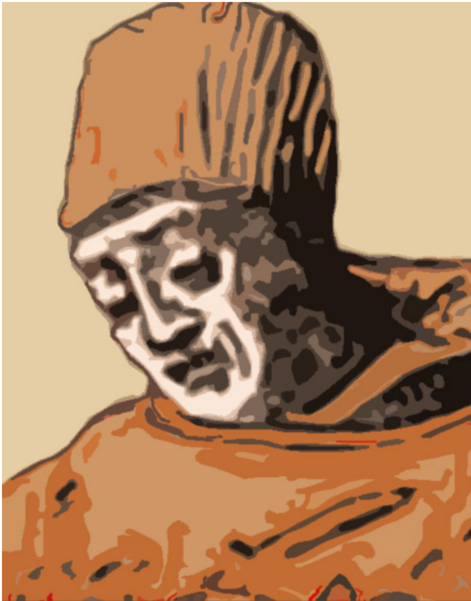
Marsilio de Padua, c. 1312