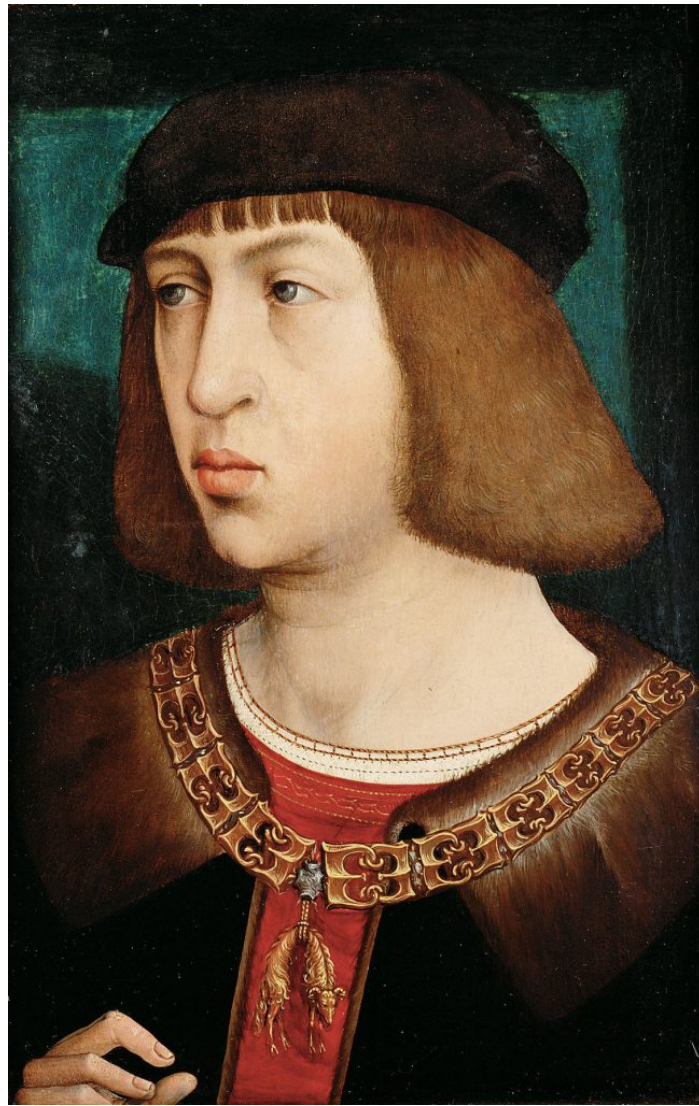
Felipe el Hermoso. Juan de Flandes, c. 1500