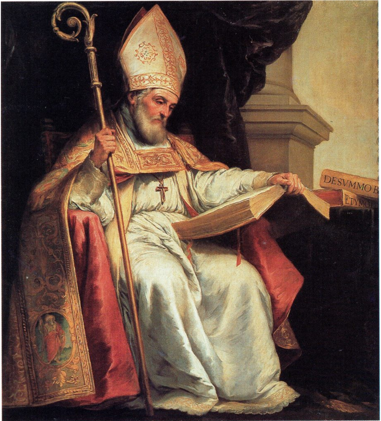
Isidoro de Sevilla. Bartolomé Murillo, c. 1655