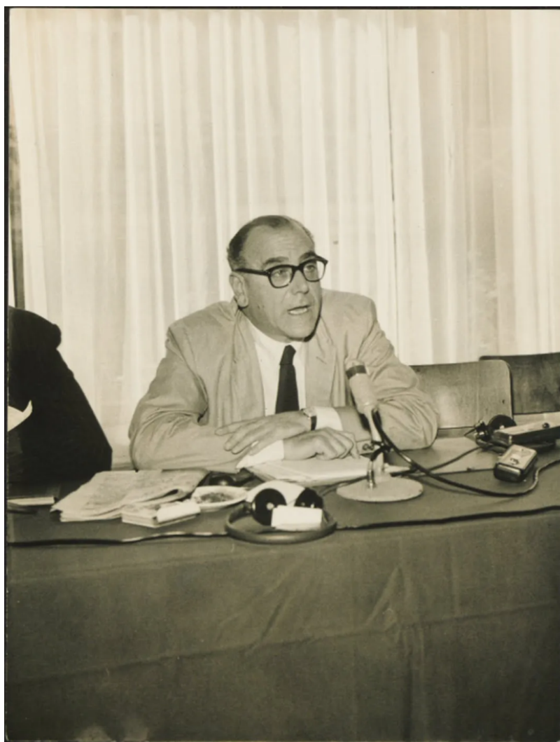
J.L. Romero, París, 1960.

Esta evocación de José Luis Romero no pretende incursionar en los aportes de su obra como historiador ni en su actividad política. Son recuerdos personales sobre una época y uno de sus protagonistas.