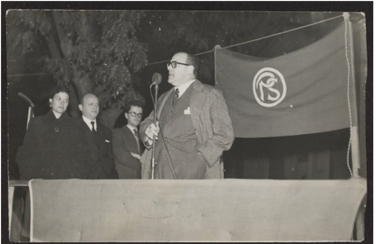
J.L. Romero en un acto del Partido Socialista en Resistencia, Chaco, 1957

En ese tiempo Romero estaba próximo a publicar La revolución burguesa en el mundo feudal . Y sus clases, sobre todo en Historia Medieval, tenían que ver con esa obra. Su perspectiva teórica estaba claramente influida por el marxismo, sin identificarse con él. La frase de Michel Foucault "on pourrait dire: l'historien marxiste, ce pléonasme" puede ser una exageración, pero sí es cierta otra afirmación del mismo autor, dicha en la misma entrevista y en la que Foucault reitera una afirmación del Che Guevara: un físico no necesita citar a Newton o a Einstein cada vez que hace física.