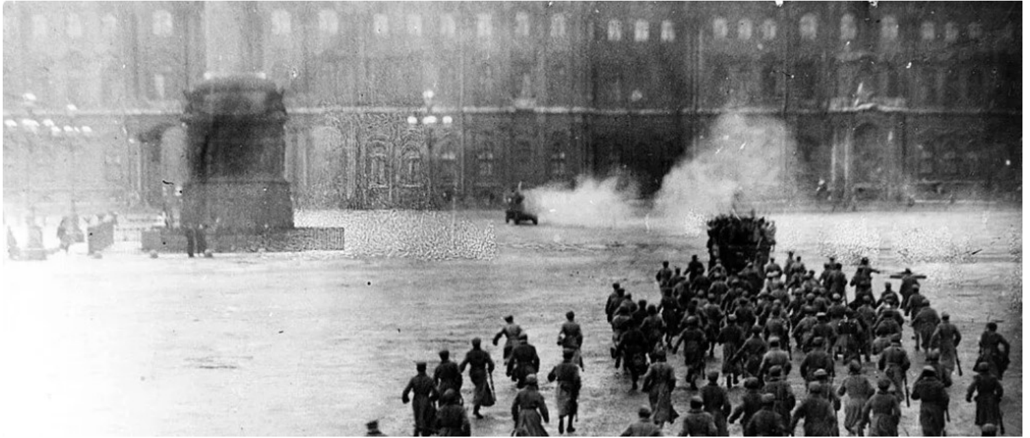
Toma del Palacio de Invierno, 1917