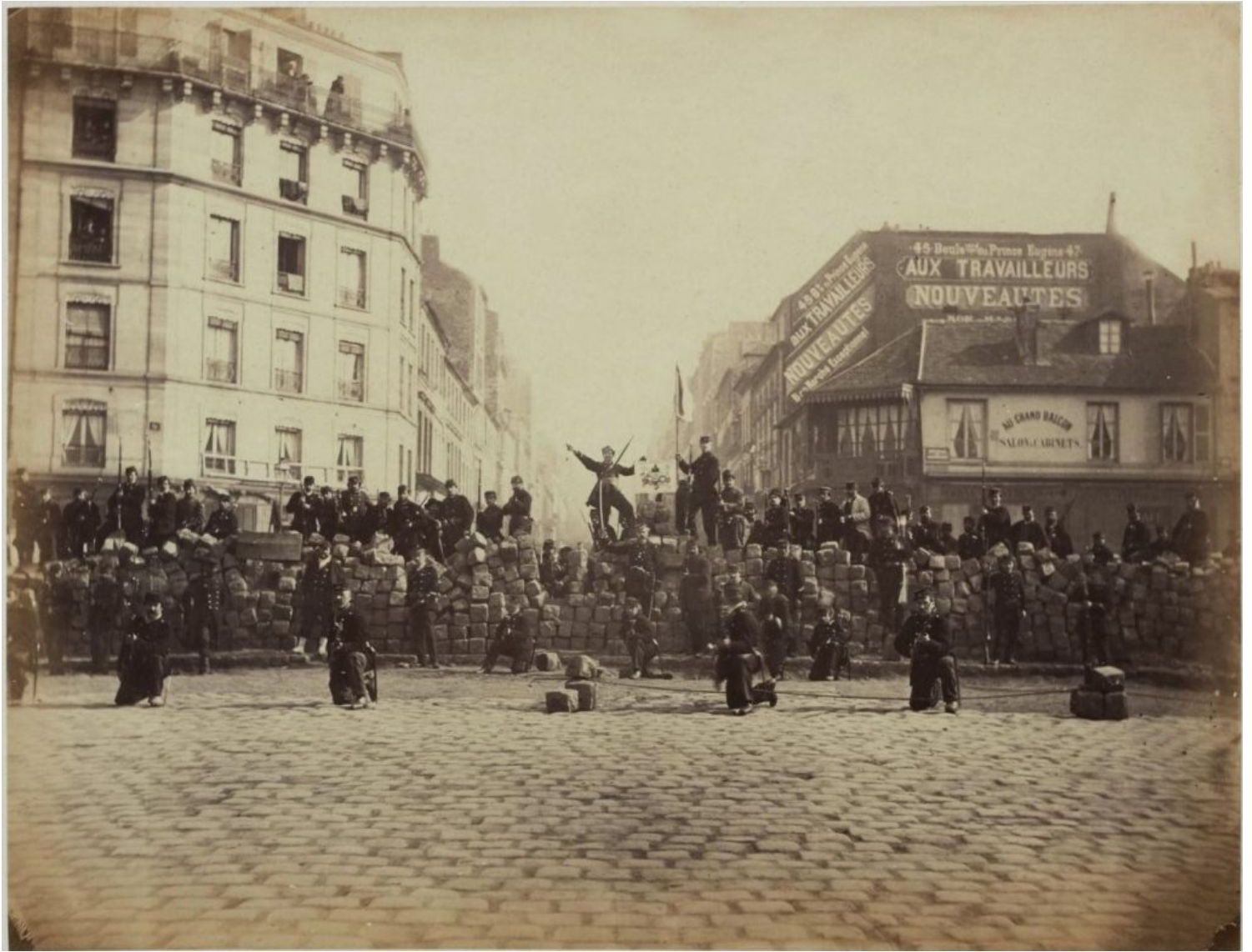
Guardias nacionales en una barricada de Belleville-París, 18 de marzo de 1871.