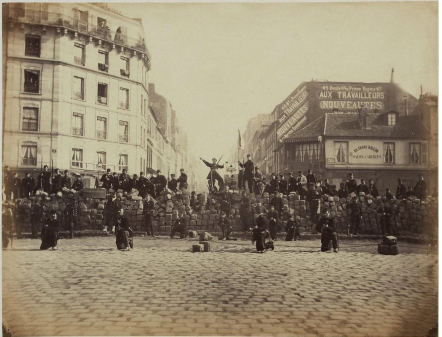
Guardias nacionales en una barricada de Belleville-París, 18 de marzo de 1871.