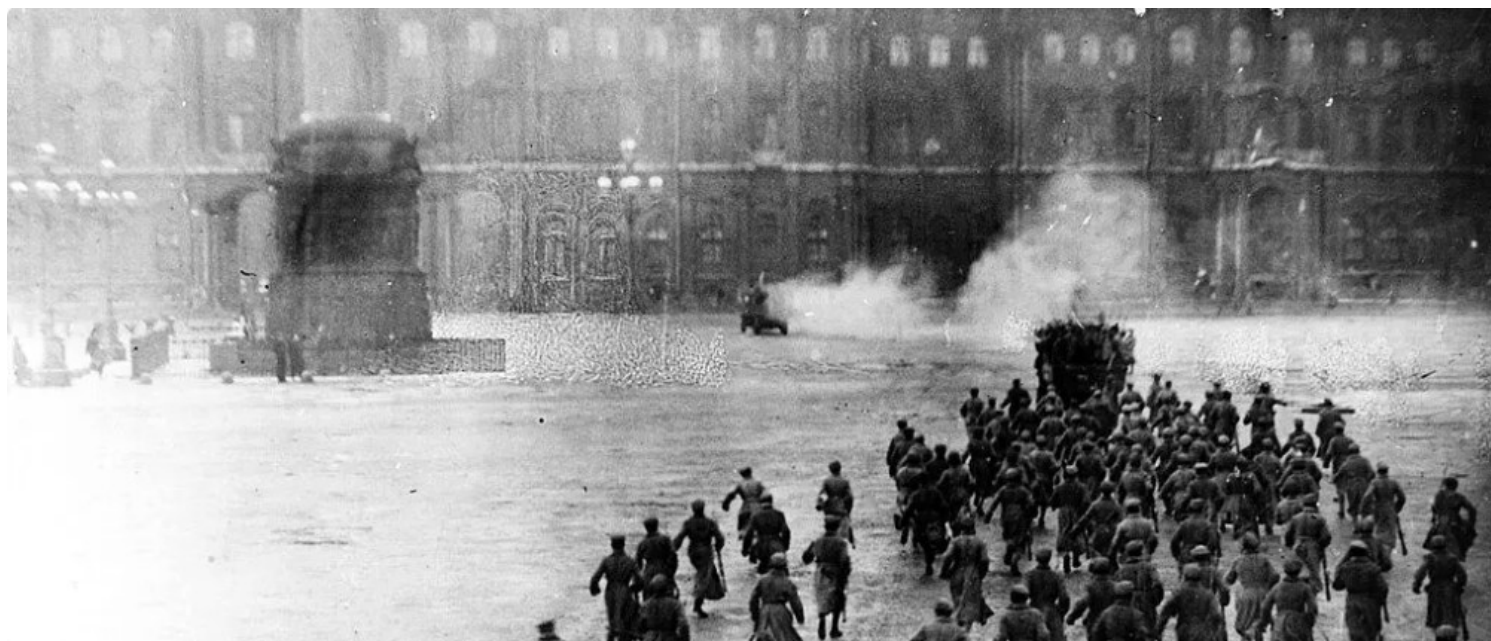
Toma del Palacio de Invierno, 1917