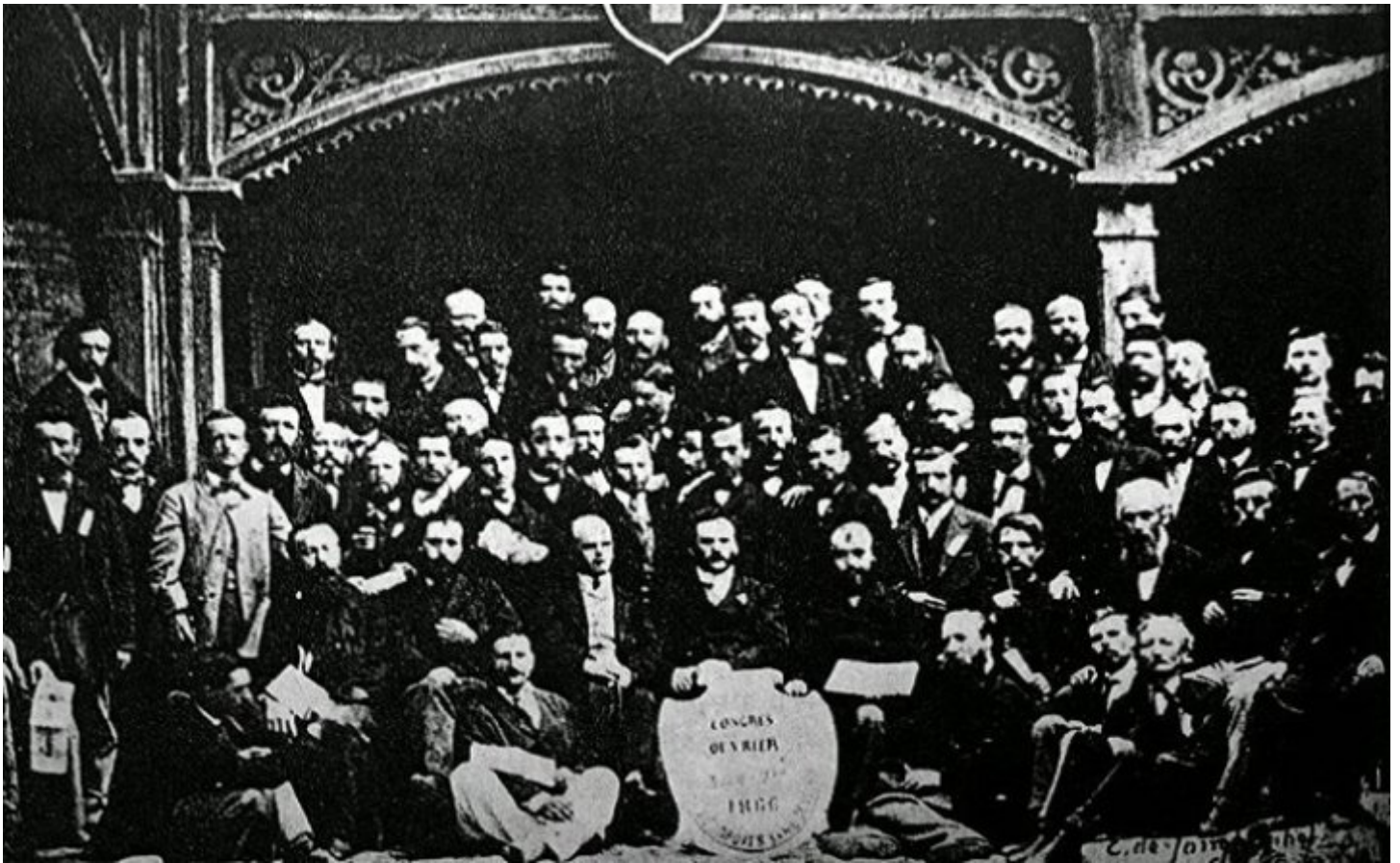
Creación de la I Internacional, 1864

El libro discurre elegante por el mundo de las ideas –tan afín a las formulaciones de la “conciencia” y particularmente atento a las de la literatura- pero su fundamento es el de una historia social que no puede prescindir de las clases encarnadas en personas. No sabemos cuán atento estaba su autor al debate entre historiadores “optimistas” y “pesimistas” respecto de los “resultados humanos” de la revolución industrial, pero no es difícil asociarlo a los segundos, tan afines al socialismo británico. La idea de que a la gente le había ido “peor” durante la revolución industrial, mucho más razonable para la primera que para la segunda mitad del siglo XIX, podría aun hoy dar pelea sin necesidad de refugiarse en argumentos cualitativos. Romero se afirma, pues, en la penuria de la clase obrera encarnada en aquellos “brazos” que conmovieron a Dickens (los llama del mismo modo) y de cuya suerte -según el relato- emergería la conciencia revolucionaria.