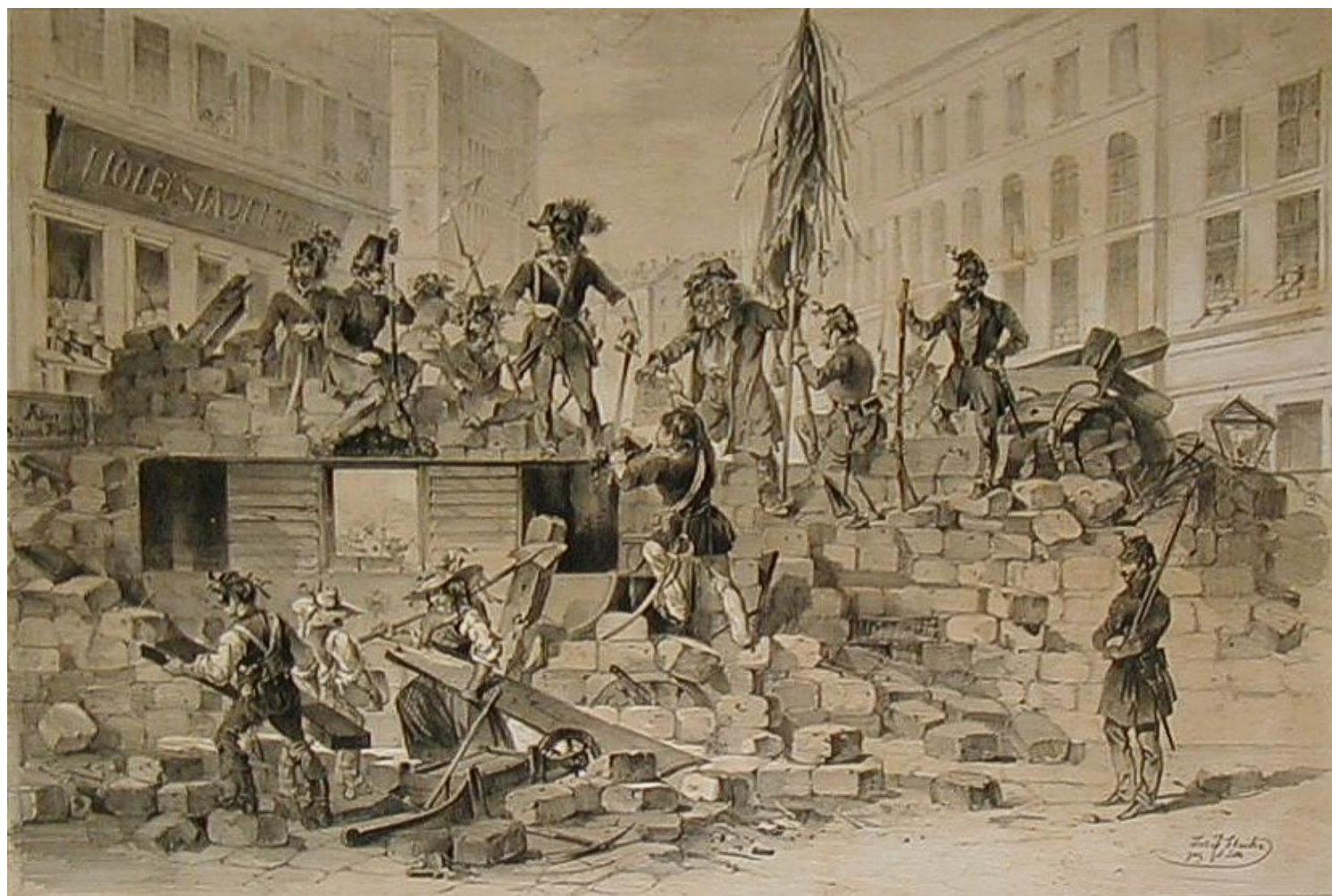
Josef Heicke, "Barricadas de Viena, 26 y 27 de mayo de 1848", litografía, 1848

21 de Agosto de 2019. Dejo la información periodística, las evaluaciones y los papers . Abro un libro nuevo. Lo adquirí hace unos meses, en su edición original de 1948, luego de que una comunicación con el hijo del autor me persuadiera de volver a leerlo.