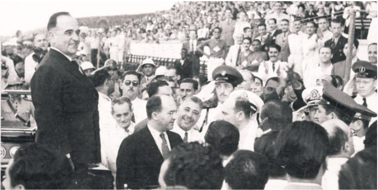
Getulio Vargas. Día del Trabajador, 1 de Mayo de 1941.

De hecho, como ya lo apuntó Gorelik (2022), la propia periodización de esta historia reposa en un criterio más político que sociocultural. La etapa de la dinámica fundacional (siglos XV-XVI) es sucedida por el largo período hidalgo cuyo corte se ubica en el reformismo borbón de finales del siglo XVIII. Esa nueva ciudad, llamada criolla, se transforma en patricia luego de las revoluciones de independencia. Medio siglo más tarde, se produce el ascenso de la ciudad burguesa, coincidente con la fase de los regímenes oligárquicos que comienza en la década de 1880, etapa que finalmente cambia con el ciclo que abren los golpes militares de los años 30.