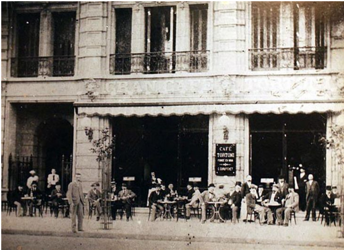
Café Tortoni. Buenos Aires.

La etapa siguiente, que corre entre los años 80 y la crisis de 1930, que en Las ideas políticas... dio lugar a la célebre fórmula de "era aluvial", en Latinoamérica... se corresponde con la fase de la "ciudad burguesa". Esta se vincula con el crecimiento del comercio internacional y, junto con él, de los contactos culturales con el Viejo Mundo. Son las costumbres europeizadas las que la elite de fin de siglo buscó emular en las ciudades latinoamericanas. No obstante, también hubo un proceso de politización social: fue una época de mitines, manifestaciones y huelgas obreras, revoluciones populares y de capas medias, creación de nuevos partidos y periódicos masivos, siempre con el objetivo de hacer efectiva la democracia. Quizás Romero no acentúe en este capítulo, como lo hace en Las ideas políticas... , el hecho de que esa politización fue resultado de lo abiertas que estuvieron las ciudades a la inmigración. Si bien este fue un rasgo especialmente marcado del caso argentino, en todos los países se produciría algún grado de politización -o al menos así lo hipotetizaría Rama (1998)- como resultado de la multiplicación de los sectores medios y populares, cuya agenda convivía difícilmente con regímenes políticos que cada vez se fueron volviendo más restrictivos.