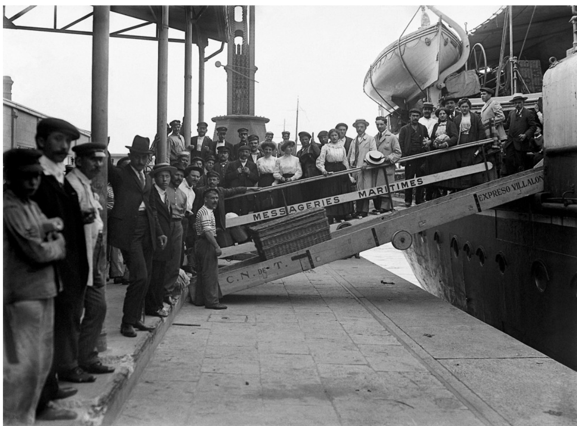
La llegada de los inmigrantes

libertades políticas se volvieron así una causa popular y de las clases medias y, en algunos países, el anarquismo y el socialismo fueron organizando cada vez más al sector obrero. La ciudad burguesa quedaría bastante alejada de un ideal de integración arrojando una imagen más cercana a la de una conflictiva yuxtaposición.