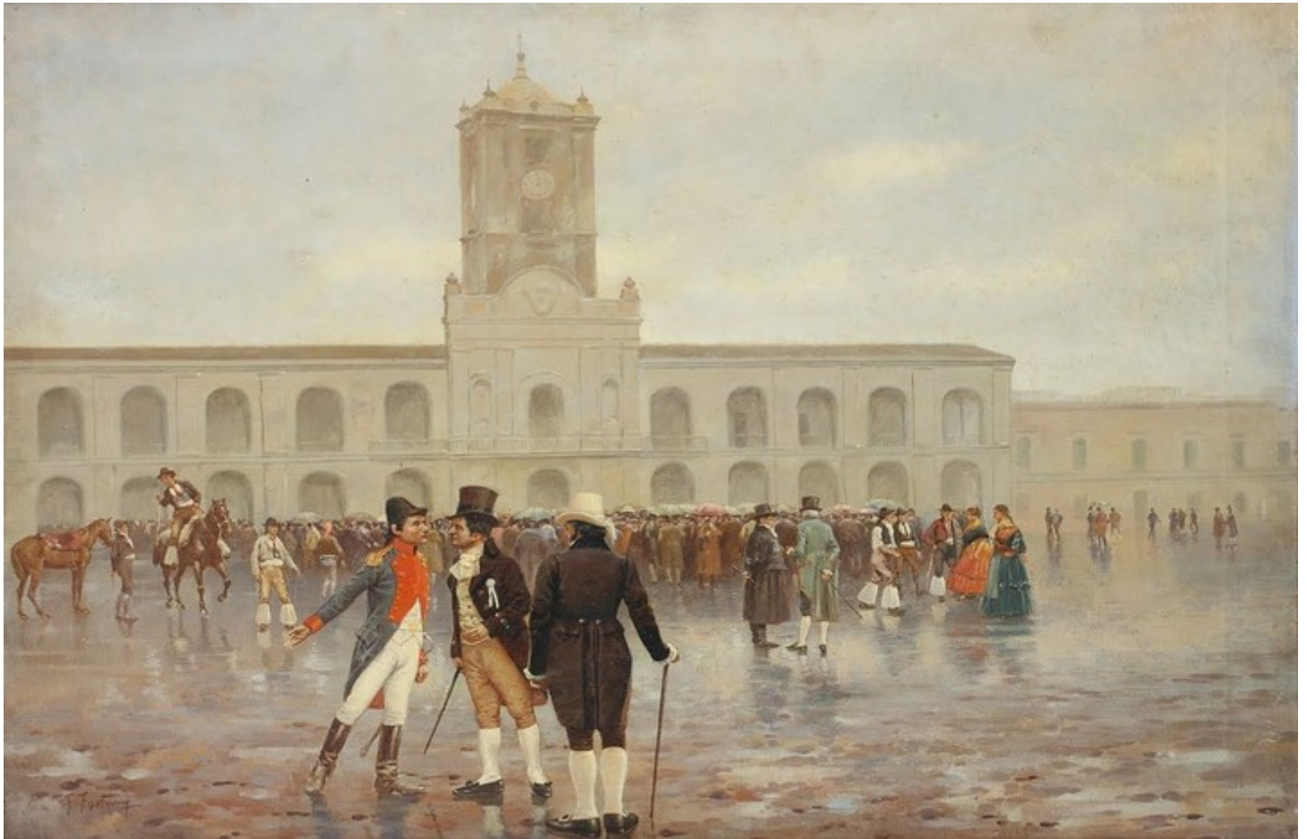
La Revolución de Mayo. Francisco Fortuny, 1910.

encuentra transversal a las iniciativas de cualquier burguesía- la ciudad criolla protagoniza una suerte de pasaje o mutación en el modo en que esa burguesía hacía política: si en la etapa reformista fue más bien un asunto ligado a la sociabilidad y el intercambio de ideas, a partir de las revoluciones se convirtió en una lucha por el acceso al poder. Solo que para participar en esa lucha la burguesía se dividió en facciones, algunas de las cuales fueron pragmáticas y recurrieron al apoyo de las "nuevas fuerzas sociales" que emergieron con el proceso revolucionario. De esa forma surgiría una nueva elite, "criolla también pero menos atada a una ideología que a una situación: la elite patricia" (p. 172).