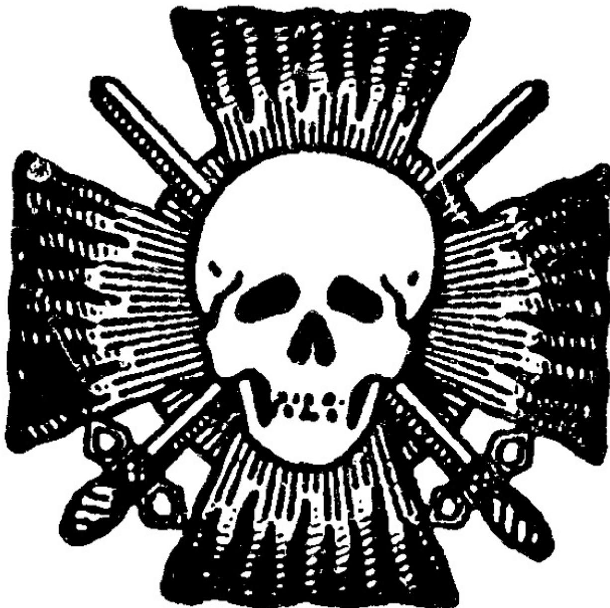
Le-Croix-de-Feu. Francia, 1927-1936

Bruselas, febrero (Por avión) – Si el soldado desconocido inspira una profunda conmiseración, es porque toda una manera de pensar se ha apoderado del hombre europeo. Y ese complejo de razonamientos y de reacciones sentimentales se proyecta también sobre el joven, adivinando en él un soldado desconocido.