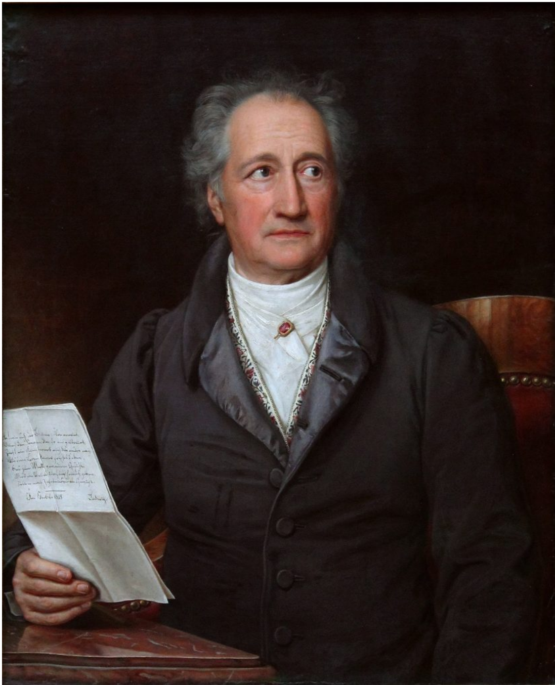
Johann Wolfgang von Goethe.