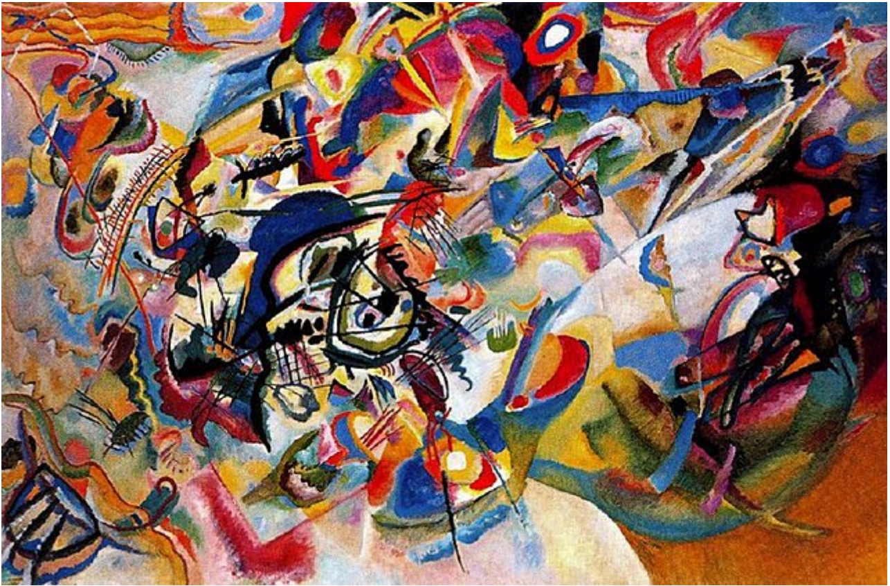
Vassili Kandinsky, Composición VII . 1913

observación una modalidad interna de la biografía, antes apenas desarrollada. Adelantemos, para facilitar la exposición, las líneas principales del problema.