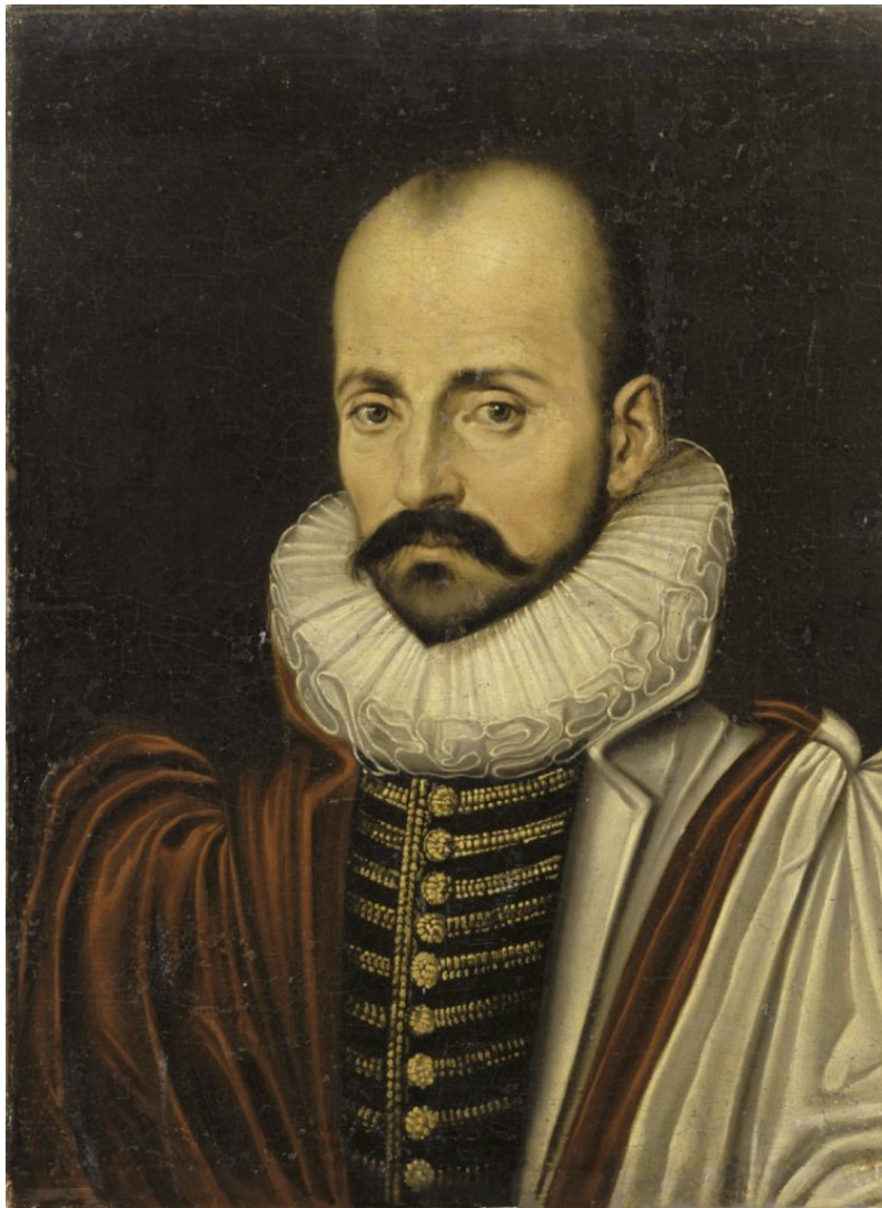
Michel de Montaigne. c. 1570

Es tarea fácil hallar en la tradición griega testimonios abundantes de la concepción arquetípica: ella la ha forjado y de ella provienen los caracteres con que luego la encontramos en la historiografía occidental. En cambio, será menos fácil encontrar ejemplos de estructura literaria y narrativa acabada. Se la adivina, y puede reconstruirse a través de numerosos pasajes de Homero, de Hesíodo(4), de Píndaro(5), de los trágicos(6) o de los historiadores.(7) Esta concepción llega hasta Cornelio Nepote —ya en el siglo I a. de C.— casi con la plenitud de su fuerza. Se advierte con nitidez allí donde las fuentes utilizadas conservaban los rasgos arquetípicos(8), pero cuando la cercanía del personaje y de los testimonios le permiten intentar una aproximación a lo individual —como en el caso del Attico(9)—, Cornelio acusa las influencias helenísticas y construye una biografía que insinúa el alejamiento del ideal arquetípico, tan débilmente como se quiera, con tendencia innegable a la biografía individualista.