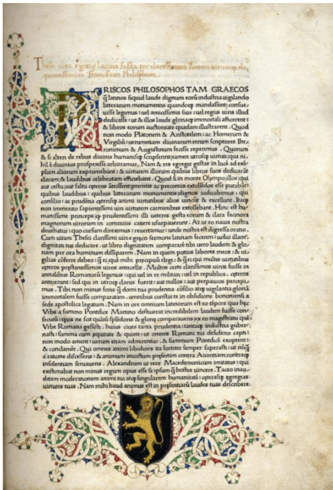
Plutarco, Vidas paralelas . Ed. Ulrich Han, 1470