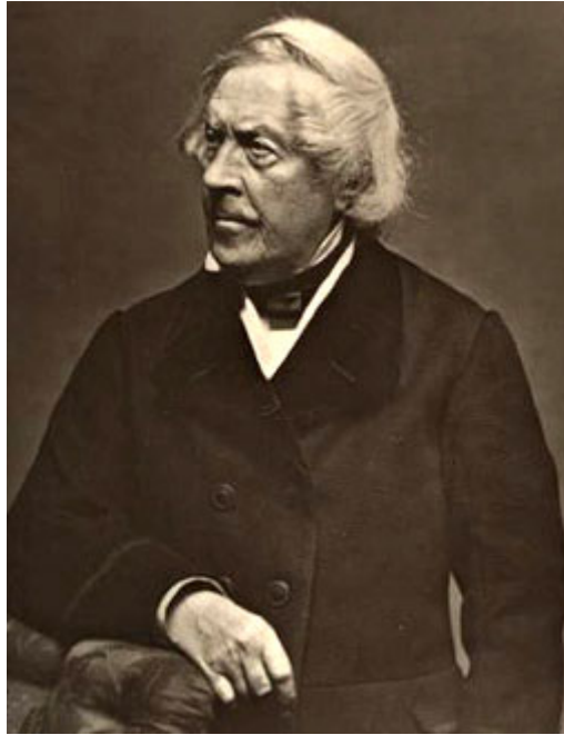
Jules Michelet. Retrato, 1874