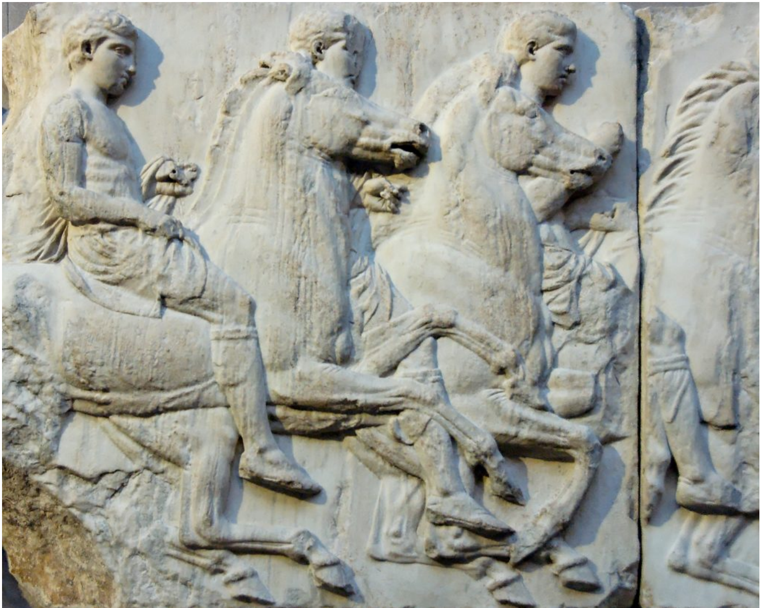
Cabalgata, Fidias. Partenón, Atenas, Grecia, 443-438 a.C.