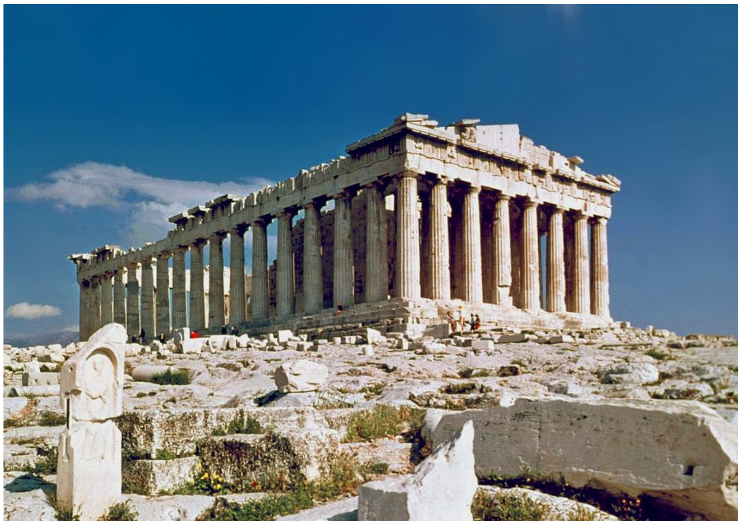
Partenón. Atenas, Grecia, 443-438 a.C.