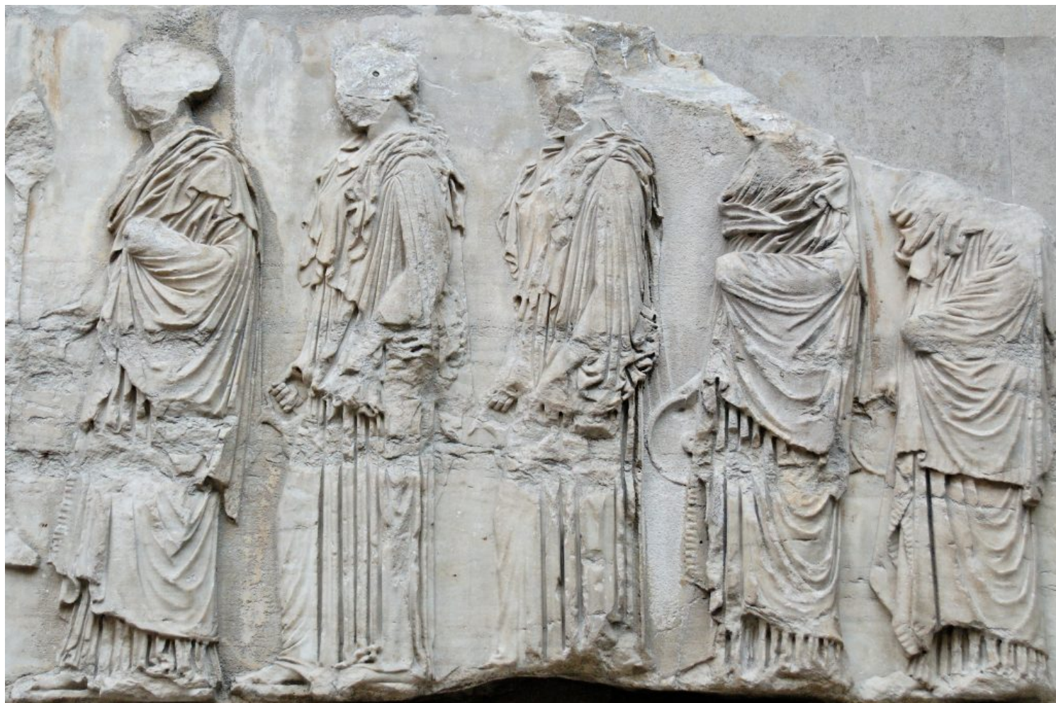
Procesión de las Panateneas. Fidias. Partenón, Atenas, Grecia, 443-438 a.C.

Somos mortales y debemos tener sentimientos de mortales , aconseja Eurípides en Alceste , combatiendo así el orgullo prometeico, tan propio del alma griega. Mientras tanto, Platón y Aristóteles han sistematizado la investigación de los límites y los caracteres de la Razón, plano humano por excelencia, distinguido del plano divino.