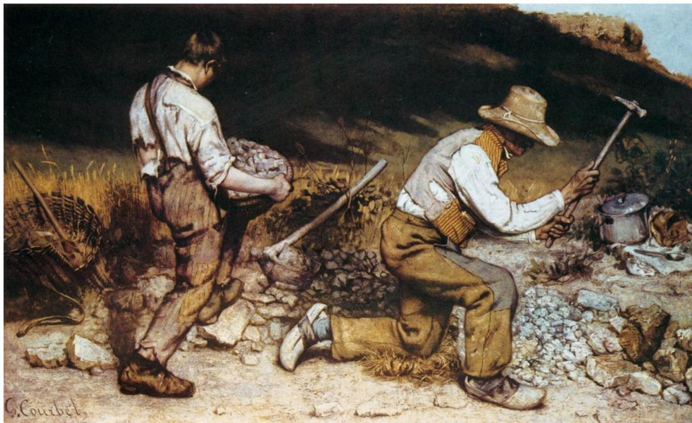
Gustave Courbet, Los picapedreros . 1850

porque el espíritu condensa aún un caudal no agotado de energía que hay que usar para descubrir y redescubrir perennemente la realidad, para atomizarla y recrearla luego en una visión multiforme más próxima a su secreta estructura, para infundirle un íntimo sentido que de por sí no posee y que alcanza gracias a lo que le es agregado por el espíritu. Y porque el espíritu sobrevive vigilante y animado por una vocación de trascender, medita y escribe aquel que siente en sí su llama.